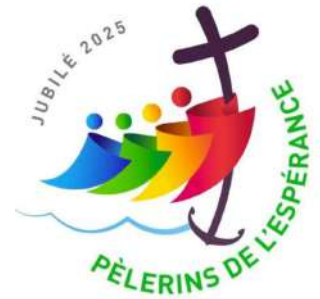
Logo du jubilé de l'Espérance 2025. Une création de Giacomo Travisani

D'après les sites internet « catéchèse.catholique.fr » et « catholiques17.fr ».