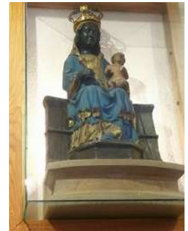
La Vierge de Commelle Vernay

(Nota 2) Avant la création du monde, le Père pensait à une mère pour son fils. C'est en quoi Marie est dite « Comblée de grâce ». ou immaculée ou plus simplement « vierge » : si le monde a été créé pour que le Fils puisse y venir et y demeurer, ce Père avait préparé un lieu pour lui, un lieu avant toute création et qui n'est pas atteint par les conséquences de la chute. Ce lieu est le ventre maternel de Marie.